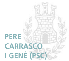
PERE CARRASCO I GENÉ (PSC)