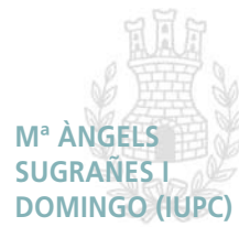
M a ÀNGELS SUGAÑES I DOMINGO (IUPC)